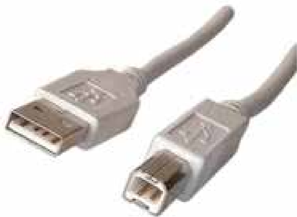
Figura 1. Cable conector usb

La conexión del periférico al computador se deber realizar mediante un cable usb ( ver figura 1 ), al puerto del equipo visiometro el cual se encuentra en la parte trasera del equipo y se puede identificar con la ( figura 2 ), una vez conectado el equipo al computador de debe encender el visiometro con él interruptor ubicado en la parte trasera del equipo.