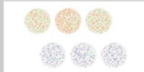
Imagen de visualización de Prueba

Cancelar < Anterior Siguiente > Enviar Resultados