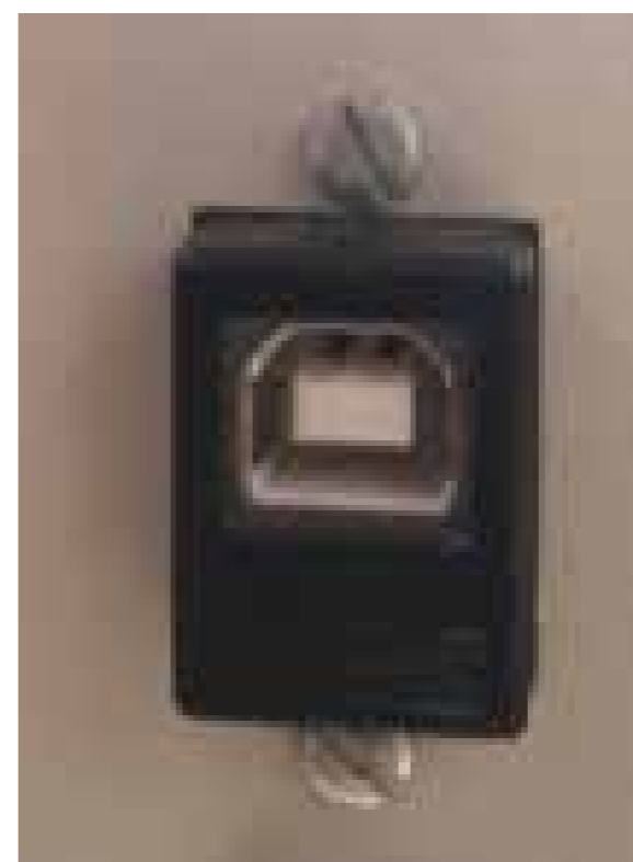
Figura 2. Puerto del equipo